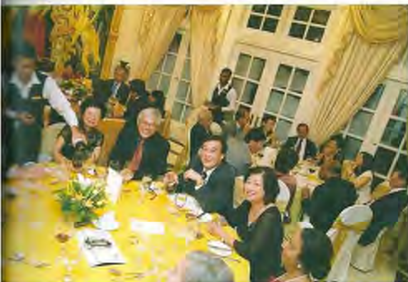
ゲストにこの夜は最高の思い出を 送ってくださることを願っています 「Excellent!」