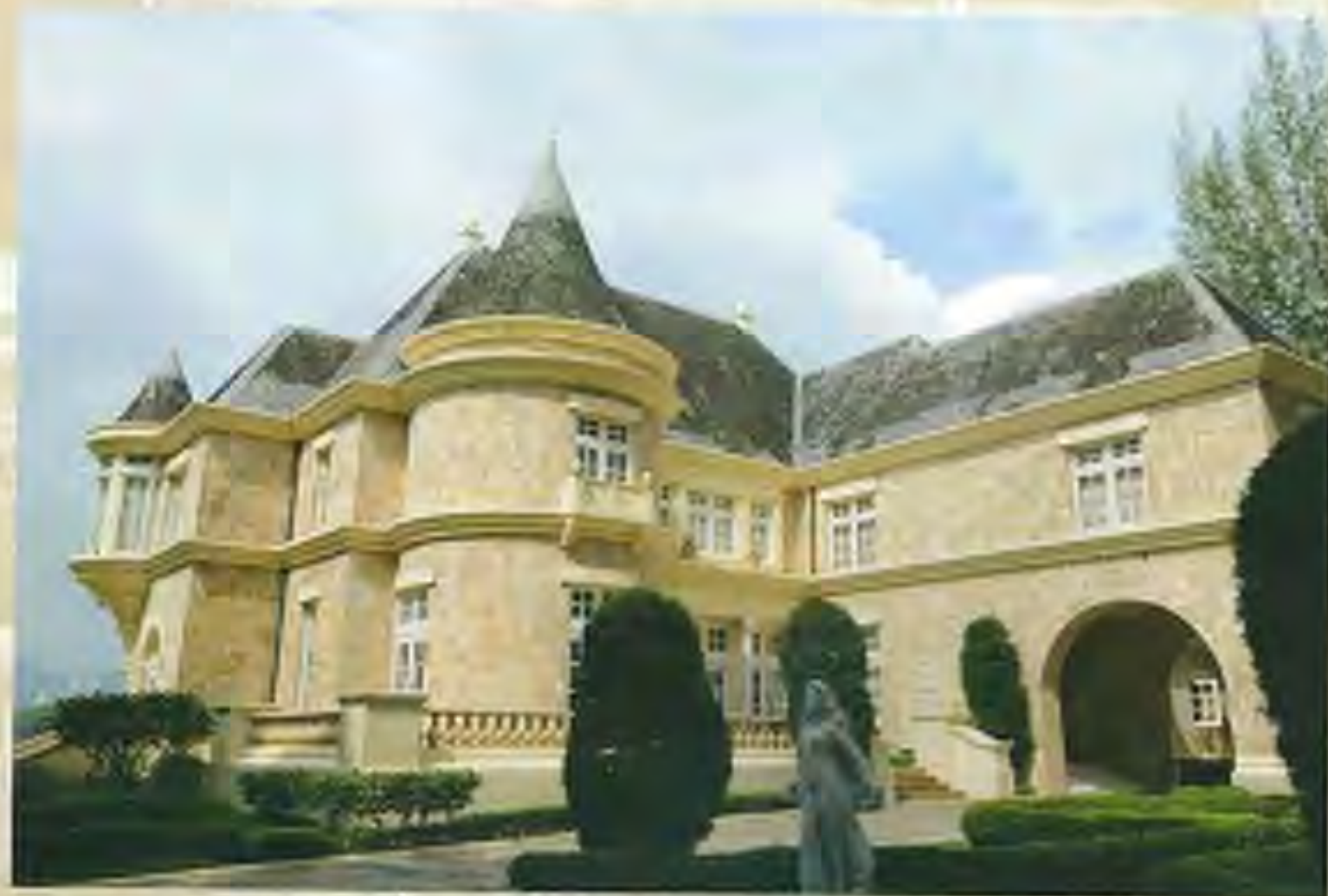
完成したVilla Primaveraの美しい外観。

「La Primavera」は絵画的にいろいろと説の多い部分があって、関連書籍がたくさん出ています。さっそくミュージアムショップで読みやすい本を買って解説を読みました。そこで「La Primavera」にボッティチェリが込めた、教会による古い体制からの解放という意味、つまりこの絵がルネサンスを象徴しているということを知り、非常に感動しました。