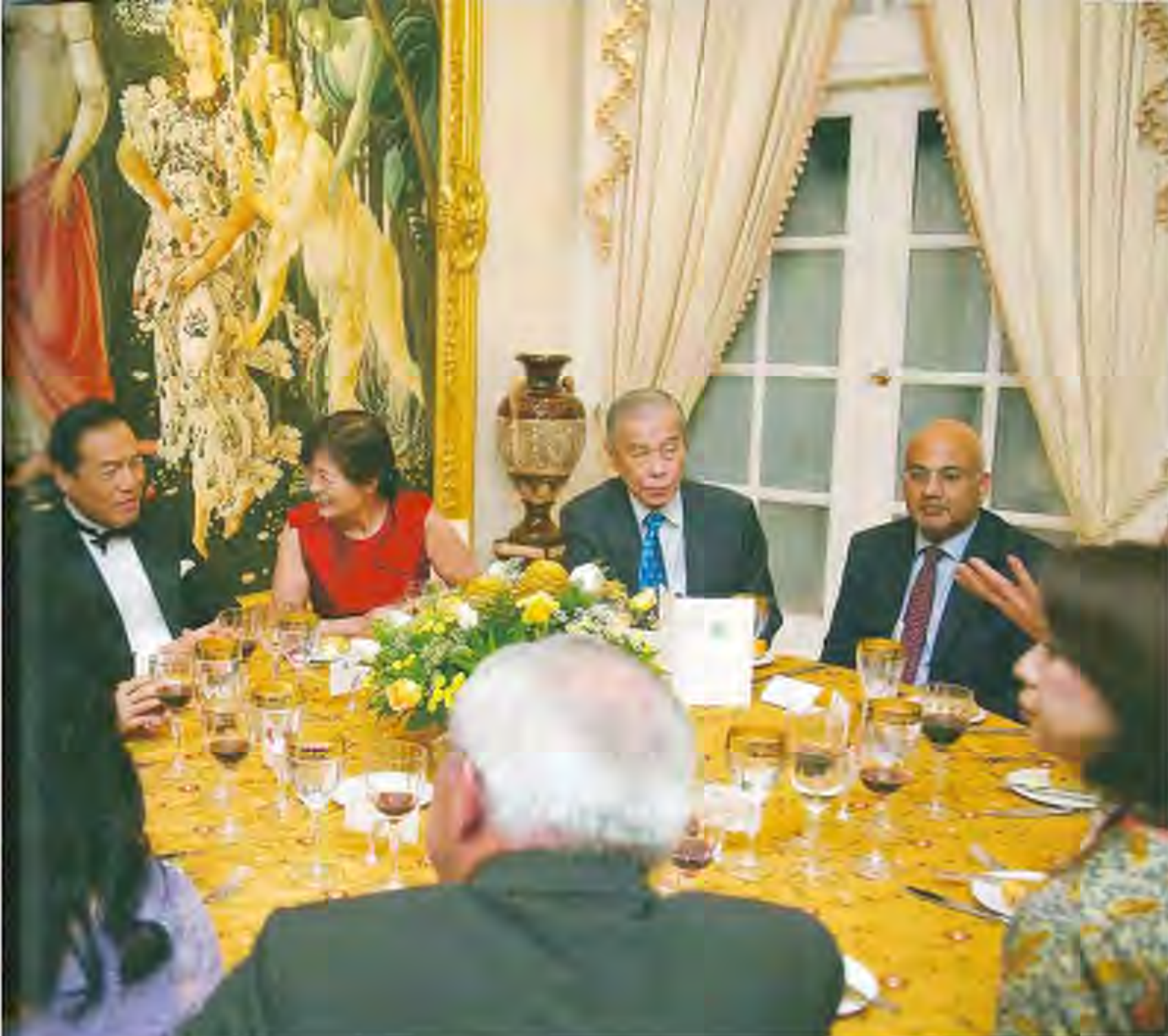
言葉とワイン、芸術—— 見ることの多い話題にワインもずかずか