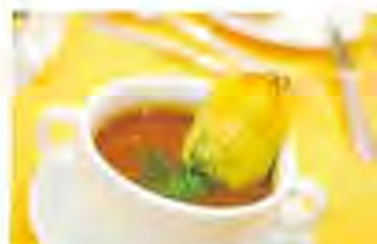
シャトー・オーブリエン、シャトー・ド・ス ペランのシェフによる特別料理。グルメ で知られるゲストも多く、一歩も遅い 料理が提供された