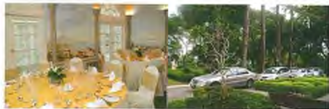
左/ 気取ったテーブルセッティング、晚餐会の華やかさが 右/ 夕陽の空を彩るパナマリゾートの建物と、 ゲストを乗せた車がパナマリゾートに到着する

上/ アジアをメインの客層で盛り上げる小西氏 下/ アジアをメインの客層で盛り上げる小西氏 パナマリゾートでは英語、マレー語、日本語が 飛び交う。地元パナマ島の客は日本人、政治家、官 僚、新聞関係者、文化人など様々な分野の一流客が、 遠方からこのコンサートのために訪れる。共通 しているのは、音楽を愛しているということだ